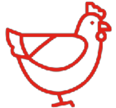
ПТИЧЬЯ ЖИВНОСТЬ 🐔